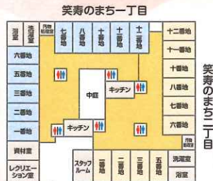
笑寿のまち二丁目